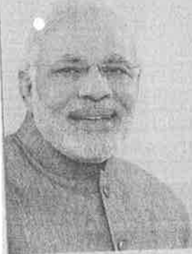
Shri Narendra Modi Hon'ble Prime Minister of India